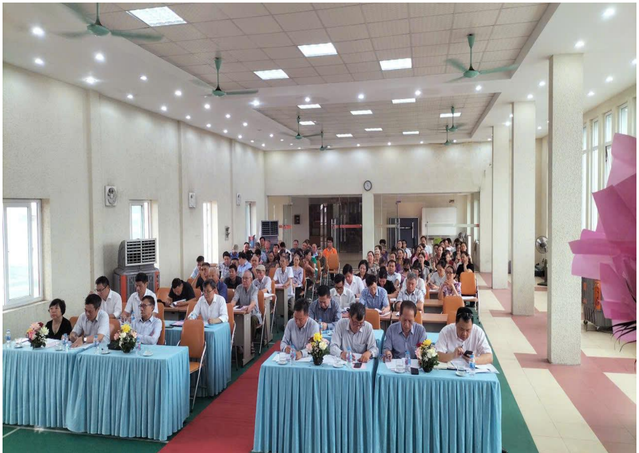
Hình ảnh tổ chức lễ gặp mặt cán bộ lãnh đạo nhân kỷ niệm 70 năm ngày thành lập công ty (Ngày 10 tháng 03 năm 2026)