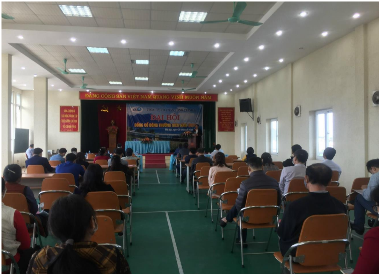
Hình ảnh biểu quyết bầu bổ sung thành viên thành viên Hội đồng quản trị