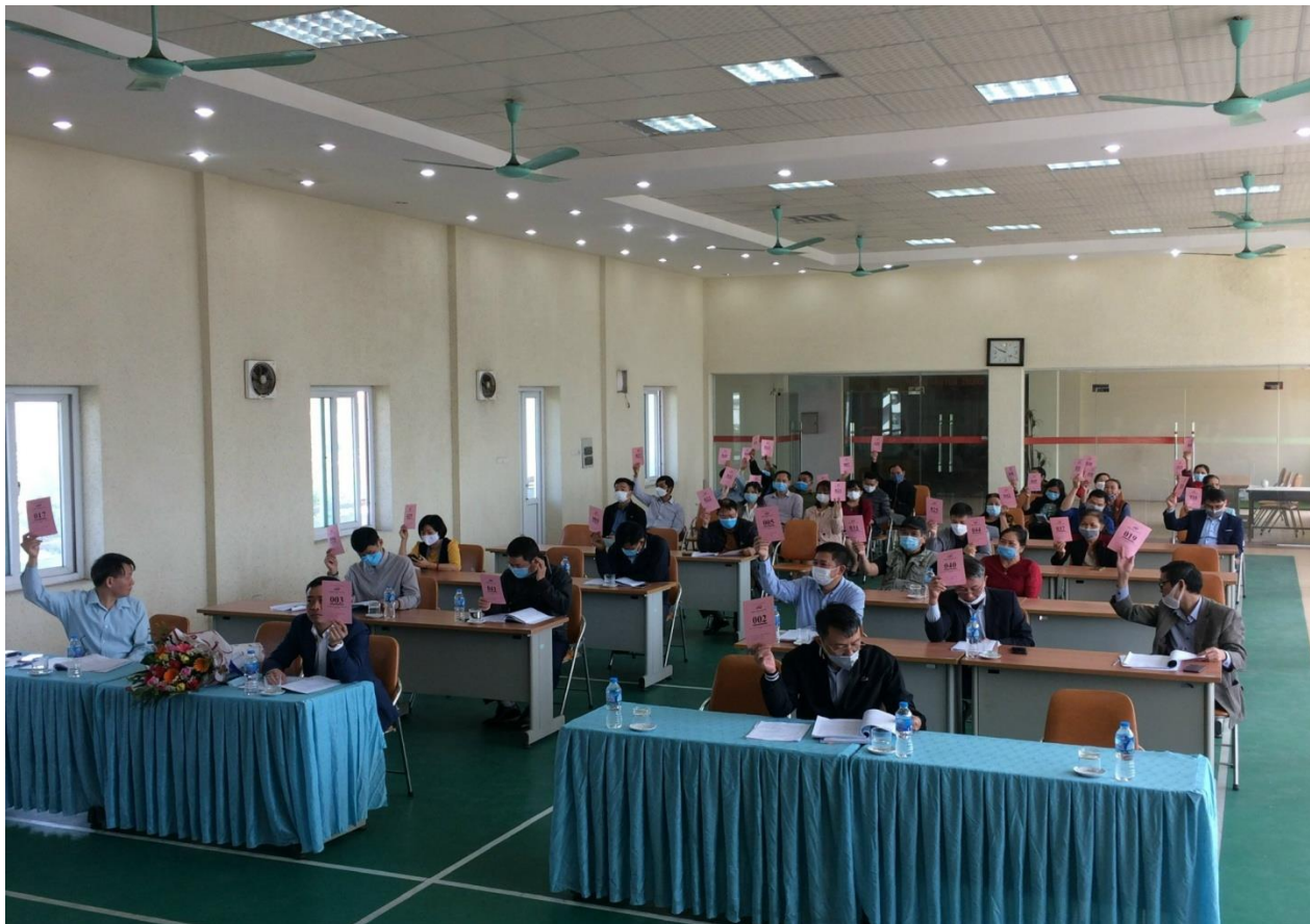
Chủ tịch giao nhiệm vụ và chúc mừng Tổng giám đốc –TVHĐQT bổ sung