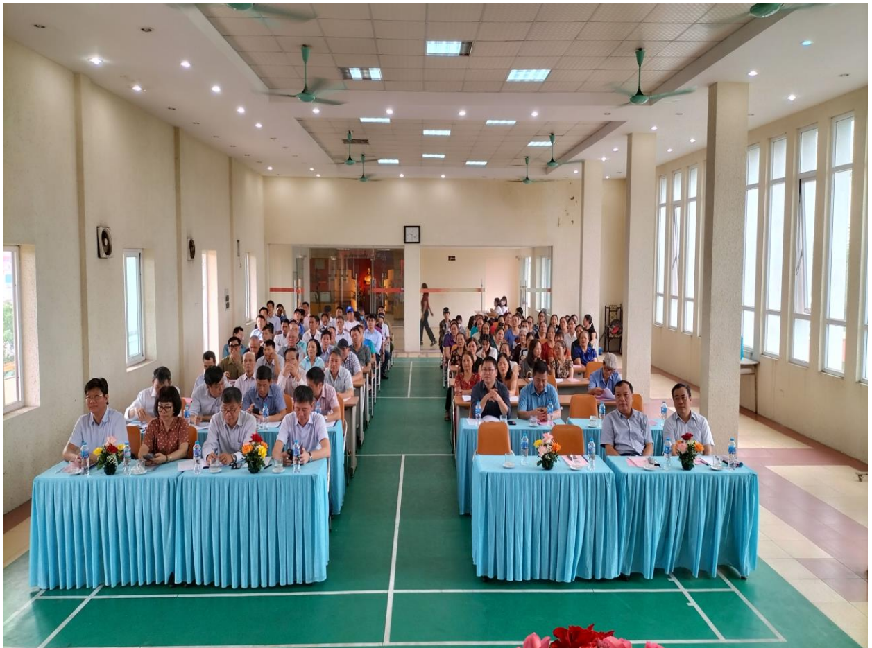
Hình ảnh Đại hội đồng cổ đông thường niên năm 2026: