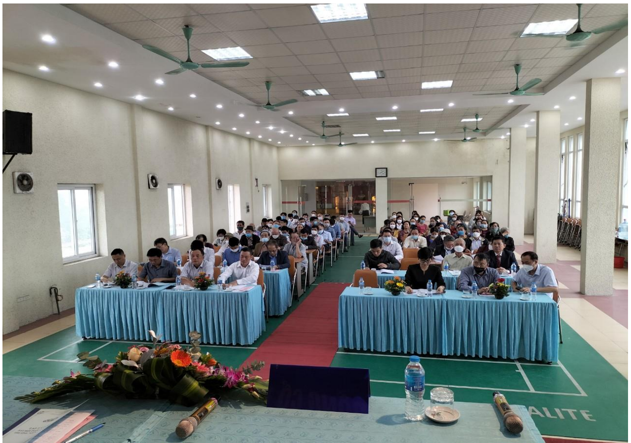
Hội đồng quản trị và Ban kiểm soát nhiệm kỳ 2022-2027.