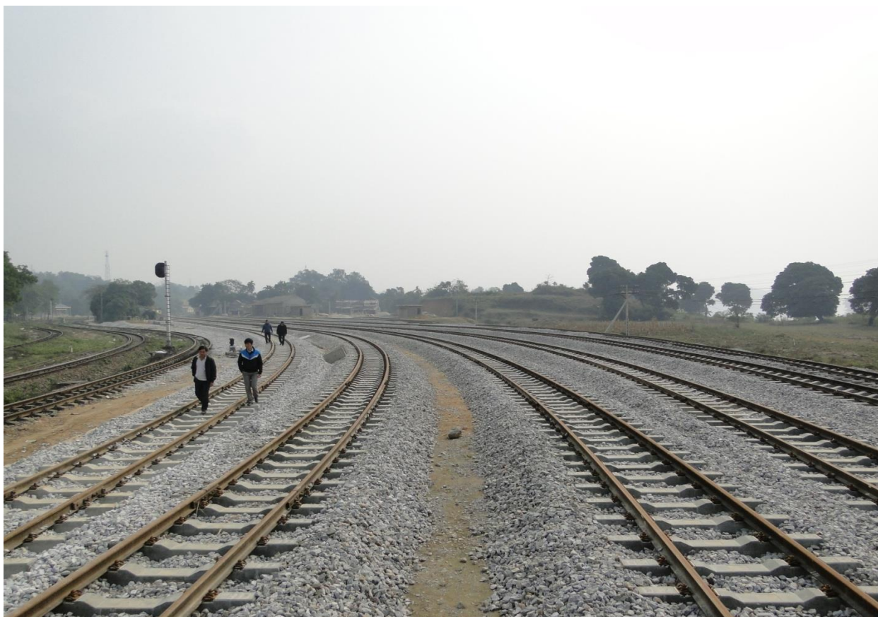
* Thi công gói thầu số 11: Công trình đường sắt Yên Viên – Phả Lại – Hạ Long – Cái Lân (Ban Quản lý dự án đường sắt RPMU):